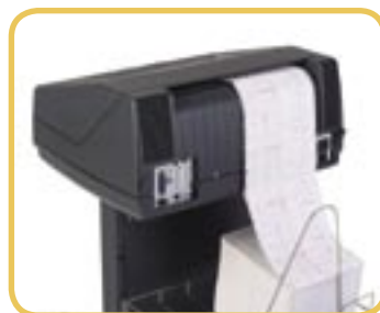
Tylni odbiornik papieru