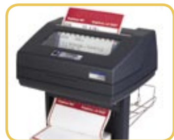
Górny odbiornik papieru