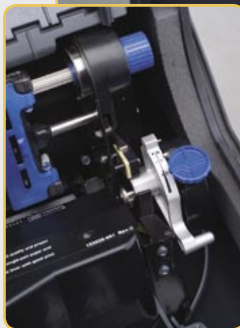
udoskonalony mechanizm wałka dociskowego